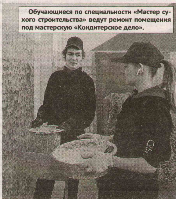
Обучающиеся по специальности «Мастер сухого строительства» ведут ремонт помещения под мастерскую «Кондитерское дело».