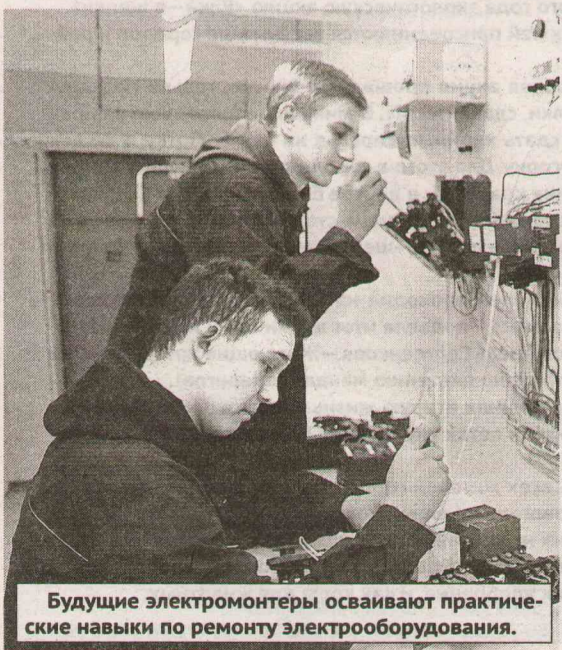
Будущие электромонтеры осваивают практические навыки по ремонту электрооборудования.