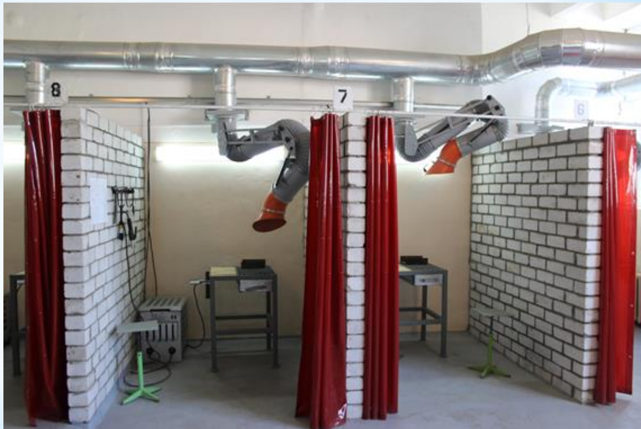
* Малоамперный тренажёр сварщика ДТС-02