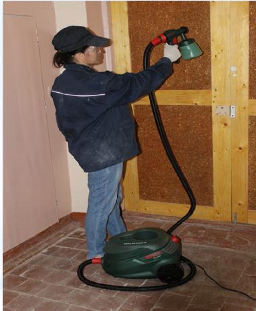
* Электрокраскопульт СО-61