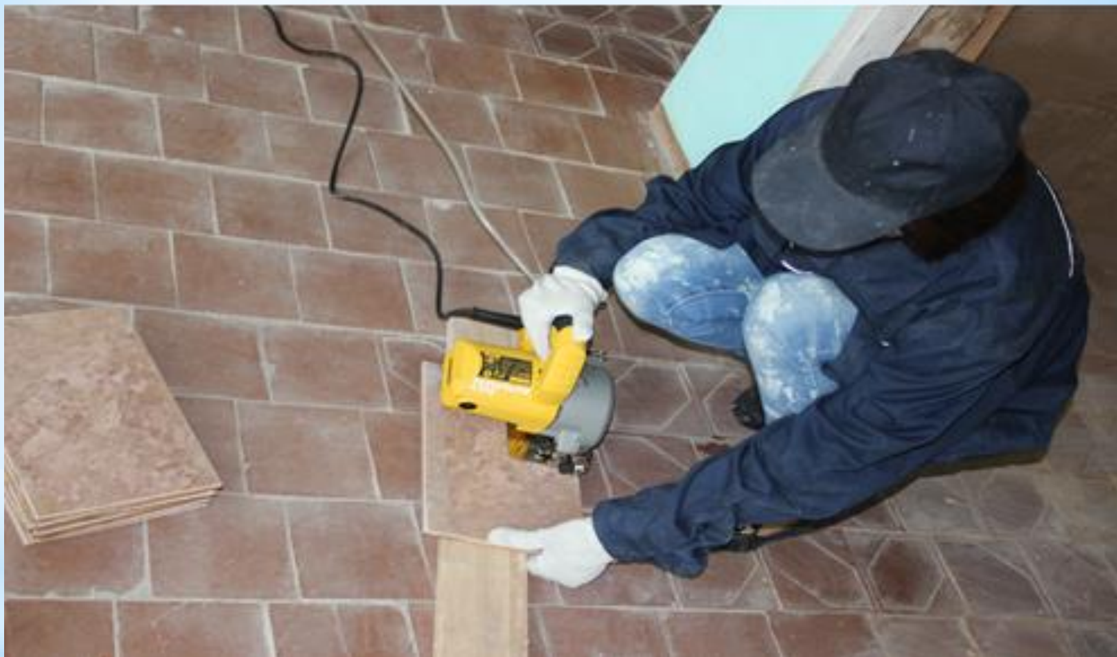
* Плиткорез электрический DWC 410