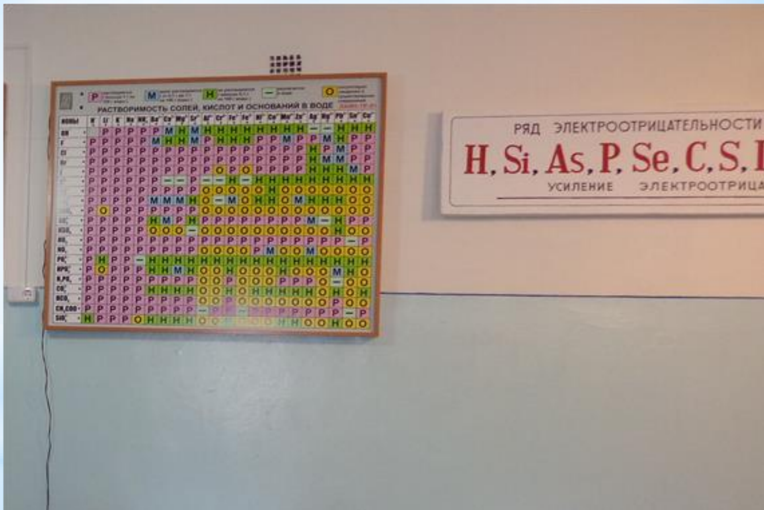
* Таблица «Растворимость солей, кислот и оснований в воде»